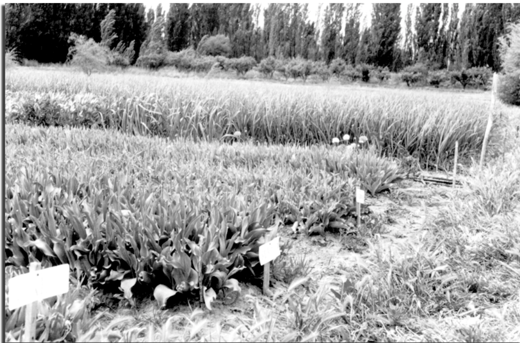
Una gran variedad de especies pueden encontrarse en Loma Grande

Cuando uno escucha hablar a Eduardo puede ver la esperanza en su voz. Atrás quedan los numerosos comienzos que la tierra y la producción suelen imponer. Ahora es la posibilidad del agroturismo: abrir la granja a los visitantes para mostrarla través de una visita de hora y media y ofrecer lo que producen: verduras orgánicas, frutas, licores, dulces y una infinita variedad de plantas aromáticas con propiedades medicinales y terapéuticas, impregnadas de sabor para condimentar alimentos o aromatizar ambientes.