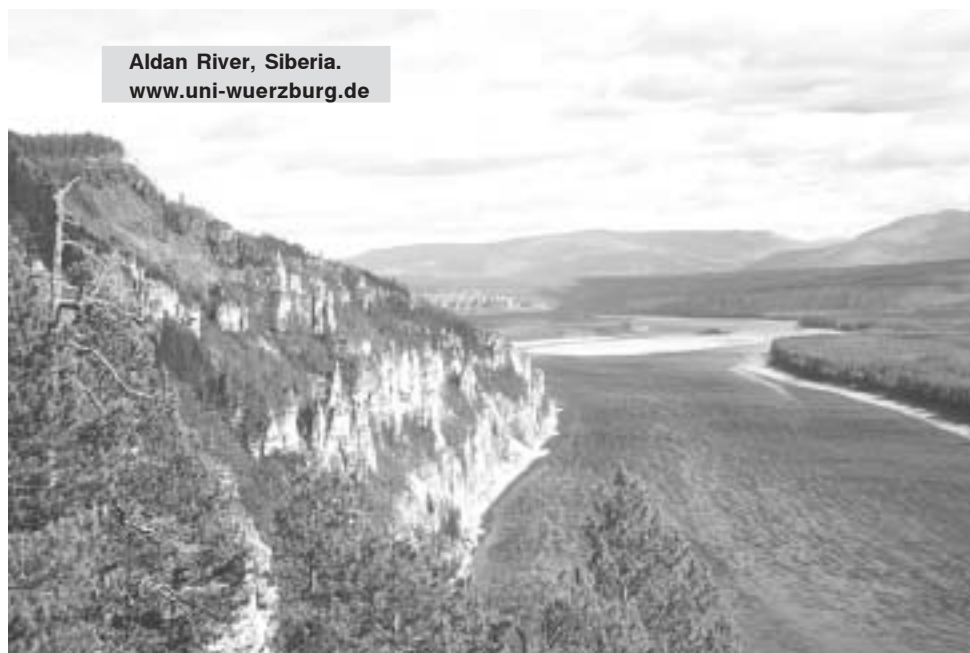
Aldan River, Siberia. www.uni-wuerzburg.de