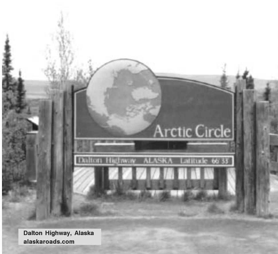
Dalton Highway, Alaska

Como productos paralelos se contempla desarrollar posteriormente las siguientes líneas de negocios: Colección de música autóctona – progresiva (“Sonidos Nórdicos”), CD-ROM interactivo de la travesía con fines educativos (“Viajando por Siberia” por ej.), Contenidos para Internet (microsites banda ancha para portales con videos interactivos), Libros fotográficos regionales, Handbook y libro de bitácora, DVD y CD-ROM fotográfico (banco de imágenes para profesionales).»