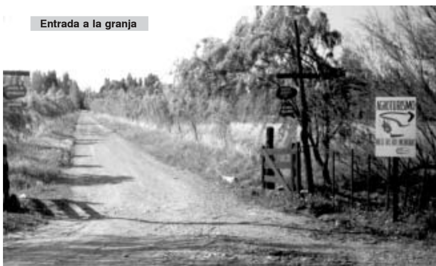
Entrada a la granja