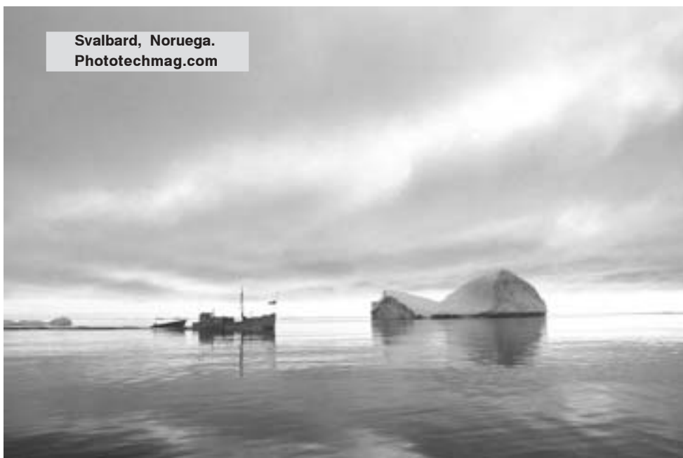
Svalbard, Noruega.

El cine documental tiene un valor cultural importantísimo y una vocación de formación permanente